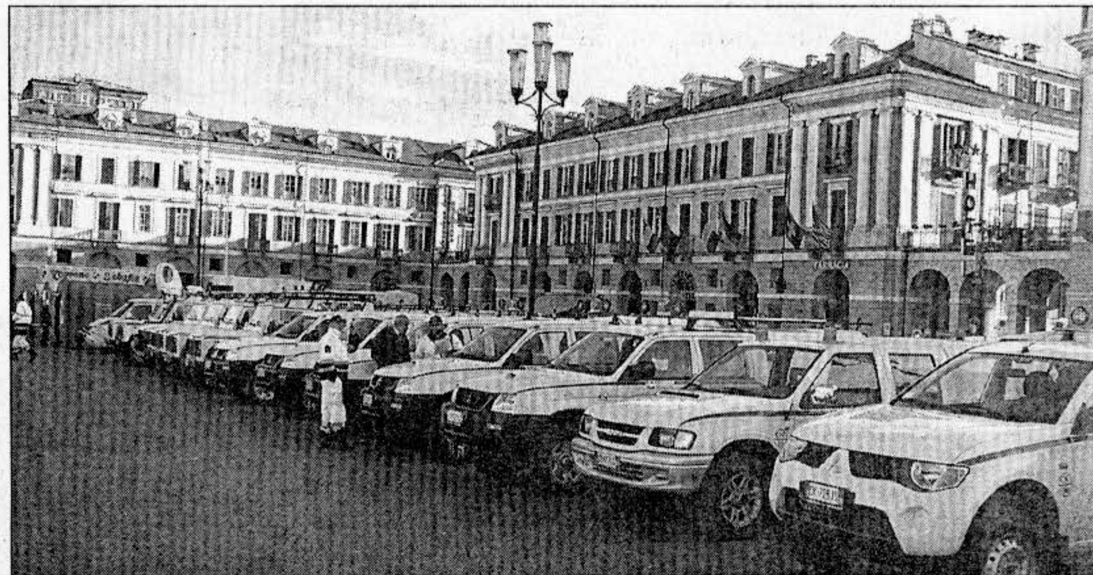
Il parco macchine della Protezione Civile in Piazza Galimberti